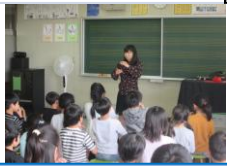
リーダー講習会(3年)4/16

たいへん立派な態度で式に臨むことができました。教室での学習もしっかりできました。6年生の歓迎の言葉も旭小のリーダーとして頼もしく、今後が楽しみです。