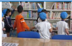
旭幼稚園体験交流会 2/15