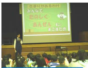
防犯教室・非行化防止教室

最初は中に入ることも躊躇していましたが、夢中になって探していました。手で触れるようになった児童もたくさんいました。