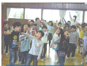
低学年なかよし集会

2年生が会を運営し、楽しく遊ぶことができました。その後、1・2年生が組になり、仲良く学校探検を行いました。