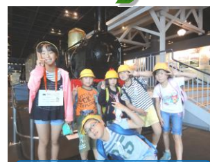
低中合同遠足 (鉄道博物館)

埼玉県警非行防止指導班「あおぞら」さんに、事件の未然防止や防犯についてお話をいただきました。