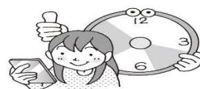
時間を決めて使う