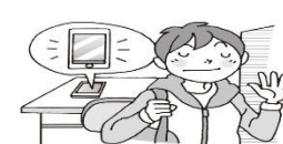
使わずに過ごしてみる